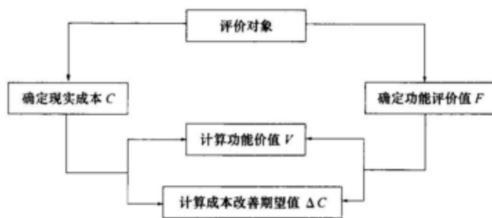
图1Z101062-3 功能评价的程序